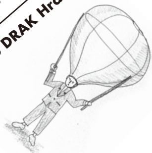
3. Divadlo DRAK Hradec Králové